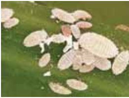
Serangga dewasa keping tepung.