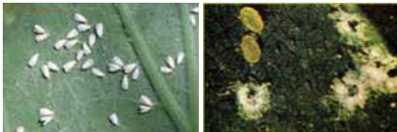
Serangga dewasa kutu kebul Bemisia tabaci .

Serangga dewasa mempunyai sayap berwarna putih terang, seperti A. disperse , tapi berukuran lebih kecil dan tidak ditutupi oleh material tepung atau lilin berwarna putih. Serangga meletakkan telur di permukaan bawah daun muda. Telur berwarna kuning terang dan bertangkai seperti kerucut. Serangga muda (nimfa) yang baru keluar dari telur berwarna pucat, tubuhnya berbentuk bulat telur dan pipih.