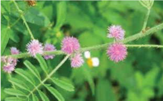
Tumbuhan M. invisa .