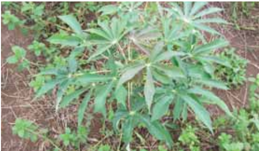
Sebagai gulma pada tanaman ubi kayu di lahan kering.