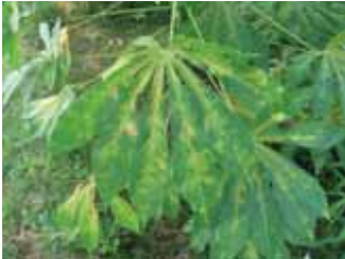
Gejala serangan tungau merah pada daun tua dan muda