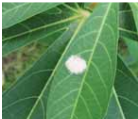
Massa telur diletakkan pada helai daun.