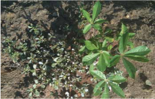
P. oleracia sebagai gulma pada tanaman ubi kayu muda.