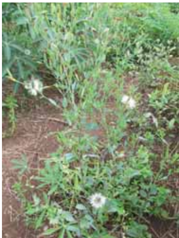
Gulma P. rudérale .