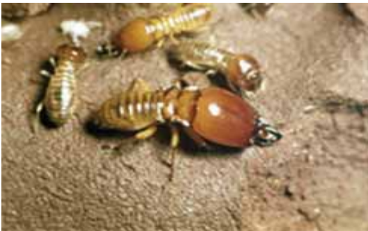
Rayap pekerja dan rayap serdadu (kepala besar)

Rayap dewasa berukuran 4–15 mm, warna bervariasi dari putih sampai coklat dan bahkan hitam, tergantung pada spesies. Rayap dapat diidentifikasi sesuai kasta dimana mereka berada.