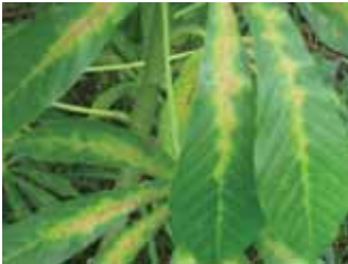
Gejala serangan hama tungau pada daun ubi kayu.