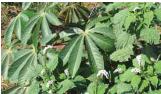
H. indicum tumbuh pada pertanaman ubi kayu di lahan kering.