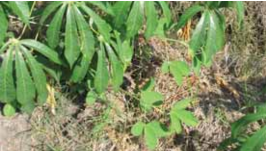
Tumbuh sebagai gulma pada pertanaman ubi kayu.