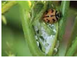
Keping tepung dimangsa oleh Coccinellidae .