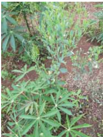
Sebagai gulma pada pertanaman ubi kayu di lahan kering.