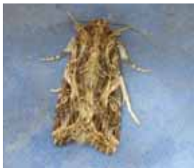
Ngengat serangga ulat grayak.