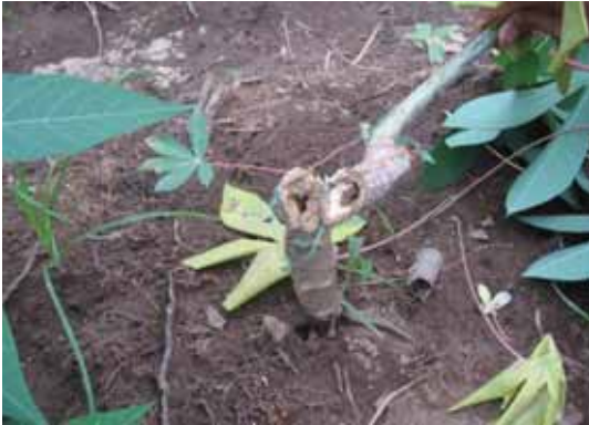
Batang tanaman ubi kayu yang berlubang digerek oleh rayap sehingga mudah patah.