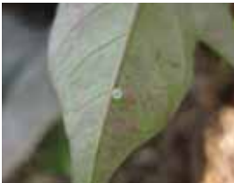
Telur ulat keket diletakkan secara individual di permukaan bawah daun.

Ulat tersebut dikenal dengan "ulat keket atau ulat tanduk" karena ulat ini mempunyai semacam tanduk di ujung kepalanya. Telur E. ello berbentuk bulat kecil dengan diameter 1 mm, berwarna hijau muda sampai kuning diletakkan secara tunggal di atas permukaan daun ubi kayu. Imago bertelur pada malam hari, seekor imago dapat bertelur sampai 1850 butir. Telur-telur menetas dalam 3–5