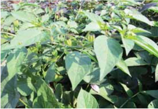
P. angulata .