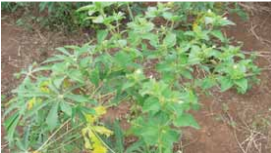
Sebagai gulma pada pertanaman ubi kayu di lahan kering.