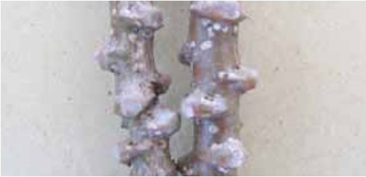
Serangan kutu perisai A. albus