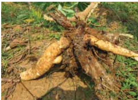
Gejala busuk pada pangkal batang dan umbi.