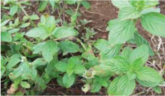
Gulma B. alata .