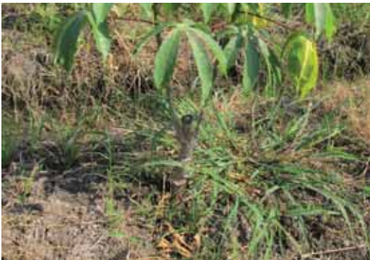
Gulma E. indica pada pertanaman ubi kayu di lahan sawah.