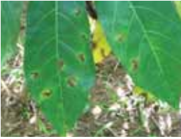
Gejala bercak menyudut