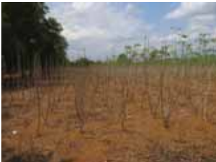
Serangan yang berat pada musim kemarau mengakibatkan sebagian besar daun menjadi rontok.