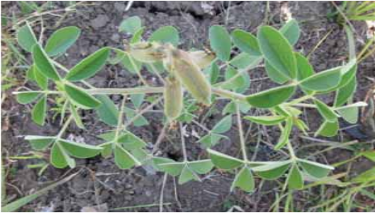
Tanaman orok-orok, C. pallida .