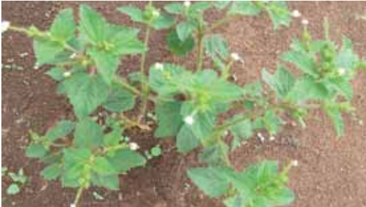
Gulma C. hirtus .