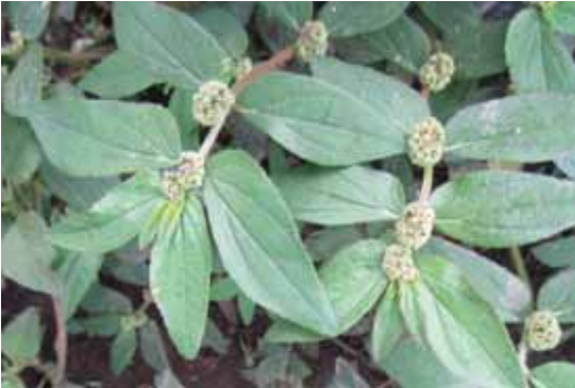
Tumbuhan E. hirta .