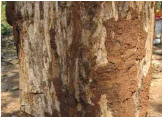
Pada hutan jati, serangan rayap pada pohon jati sering menjadi sumber infestasi rayap.