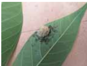
Telur yang menetas menjadi larva instar-1.