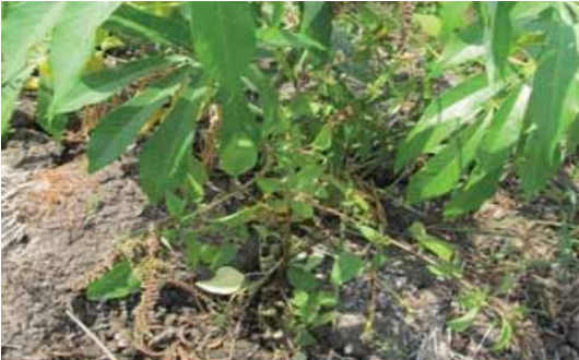
Gulma tumbuh pada pertanaman ubi kayu muda.