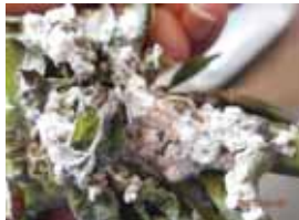
Serangan keping tepung pada daun muda mengakibatkan daun menjadi keriting (malformasi) dan daun mati.