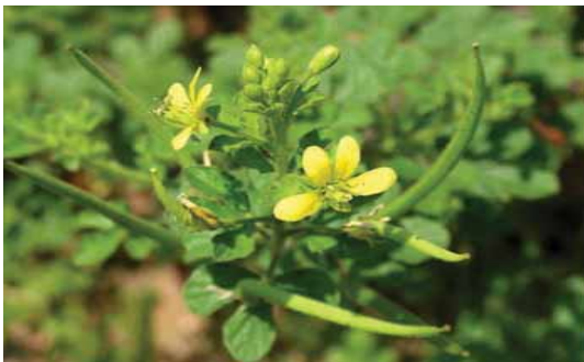
Gulma C. viscosa , sedang berbunga dan berpolong muda.