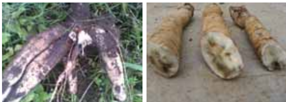
Gejala busuk pada umbi.