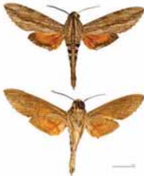
Serangga dewasa Erinnyis ello .