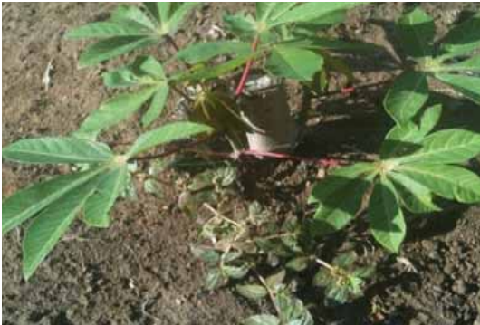
E. hirta sebagai gulma tumbuh di dekat pohon ubi kayu.