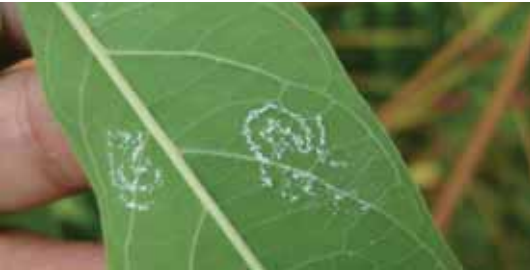
Pola spiral/melingkar untuk meletakkan telur