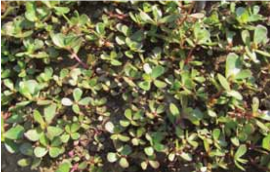
P. oleracia .