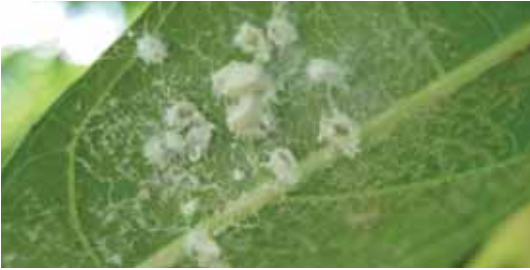
Serangga dewasa A. disperses diselimuti semacam tepung/lilin.