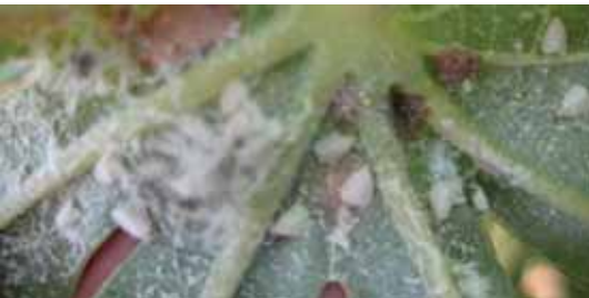
Kelompok telur, larva, pupa dan imago di permukaan bawah daun.