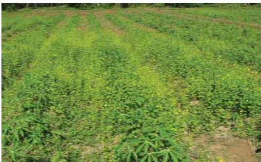
Tumbuh lebat sebagai gulma pada pertanaman ubi kayu muda.