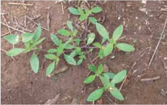
Tanaman Althernanthera sessilis .