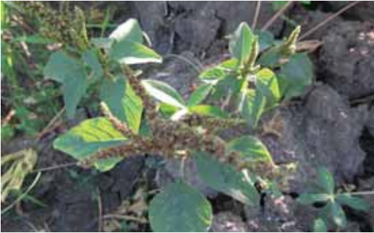
Gulma A. gracilis .