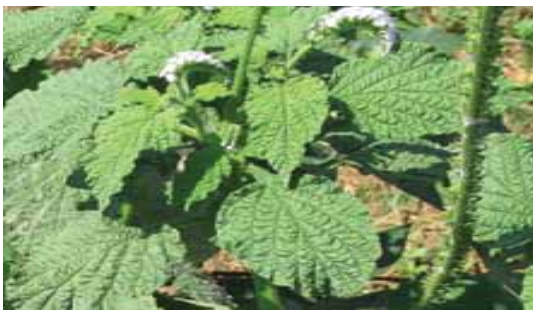
Gulma H. indicum .