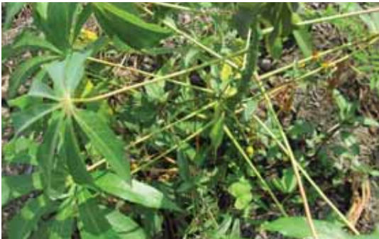
Gulma A. sessilis pada tanaman ubi kayu.