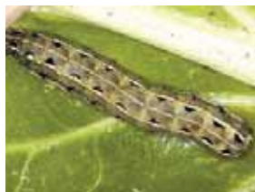
Ulat grayak instar-4.