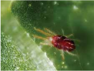
Tungau merah, Tetranychus urticae .