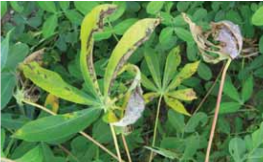
Infeksi berat mengakibatkan daun menguning dan rontok.