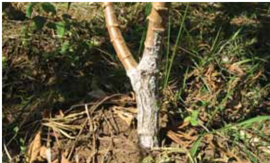
Serangan keping pada batang atau pangkal batang mengakibatkan batang tidak dapat digunakan untuk bibit atau stek.