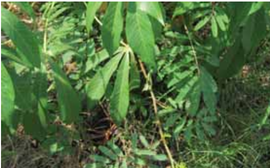
Sebagai gulma M. invisa membelit tanaman ubi kayu.