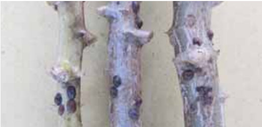
Serangan kutu perisai, Saissetia sp. Serangan kedua kutu perisai tersebut mengakibatkan batang tidak layak dijadikan bibit (stek).