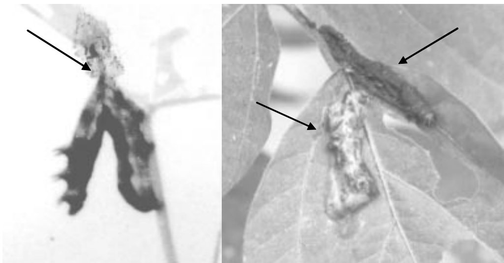
Gambar 2. Larva Spodoptera litura yang mati terinfeksi NPV membentuk huruf “V” terbalik (a) dan tidak seperti huruf “V” terbalik dan larva yang sudah pecah (b). (Bedjo, 2003)