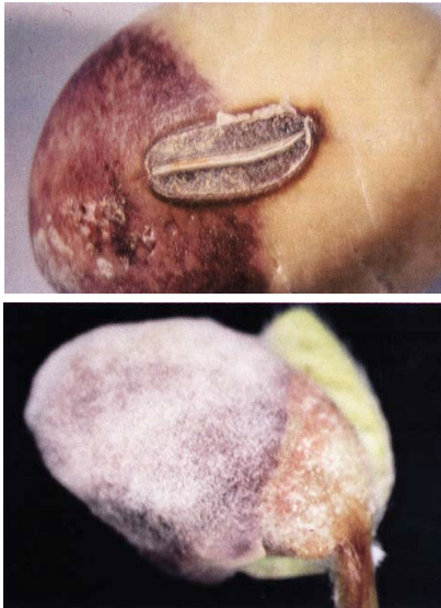
Gambar 1. Bercak ungu pada biji kedelai dan keping kecambah yang terserang jamur C. kikuchii (Sumber: McGee dan Nyvall 2008).

yang tepat. Metode pengujian yang lazim dilakukan dalam deteksi patogen benih adalah pemeriksaan secara kering, cara basah melalui perendaman, dan cara inkubasi melalui pemeraman pada media tertentu (metode konvensional yang relatif sederhana dan tidak mahal). Masing-masing cara deteksi tersebut memiliki tujuan khusus seperti diuraikan sebagai berikut.