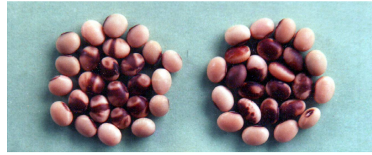
Gambar 2. Kelainan warna kulit biji kedelai berupa bercak coklat yang diakibatkan oleh virus SMV atau soybean mosaic virus.

Demikian juga virus SMV pada kedelai, dapat diperiksa secara visual adanya kelainan warna kulit biji berupa bercak berwarna kecoklatan hingga kehitaman yang menyelaputi kulit ari biji (Gambar 2). Biji belang tersebut sebagai indikasi bahwa di lapangan tanaman induk terinfeksi SMV. Pemeriksaan secara visual perlu diikuti dengan metode pemeriksaan yang lain seperti diuraikan di bawah ini.